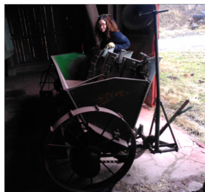
Sättmaskinen är från 1970.