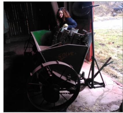
Potatisraderna är raka och de ”fria” odlingslotterna kilformade.